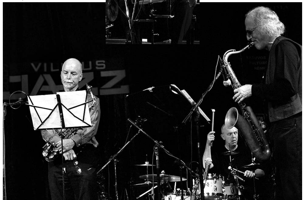
• ROVA special

ке Vilnius Jazz Extra Line – я говорю о молодежной группе Magic Mushrooms.