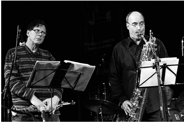
• ROVA special