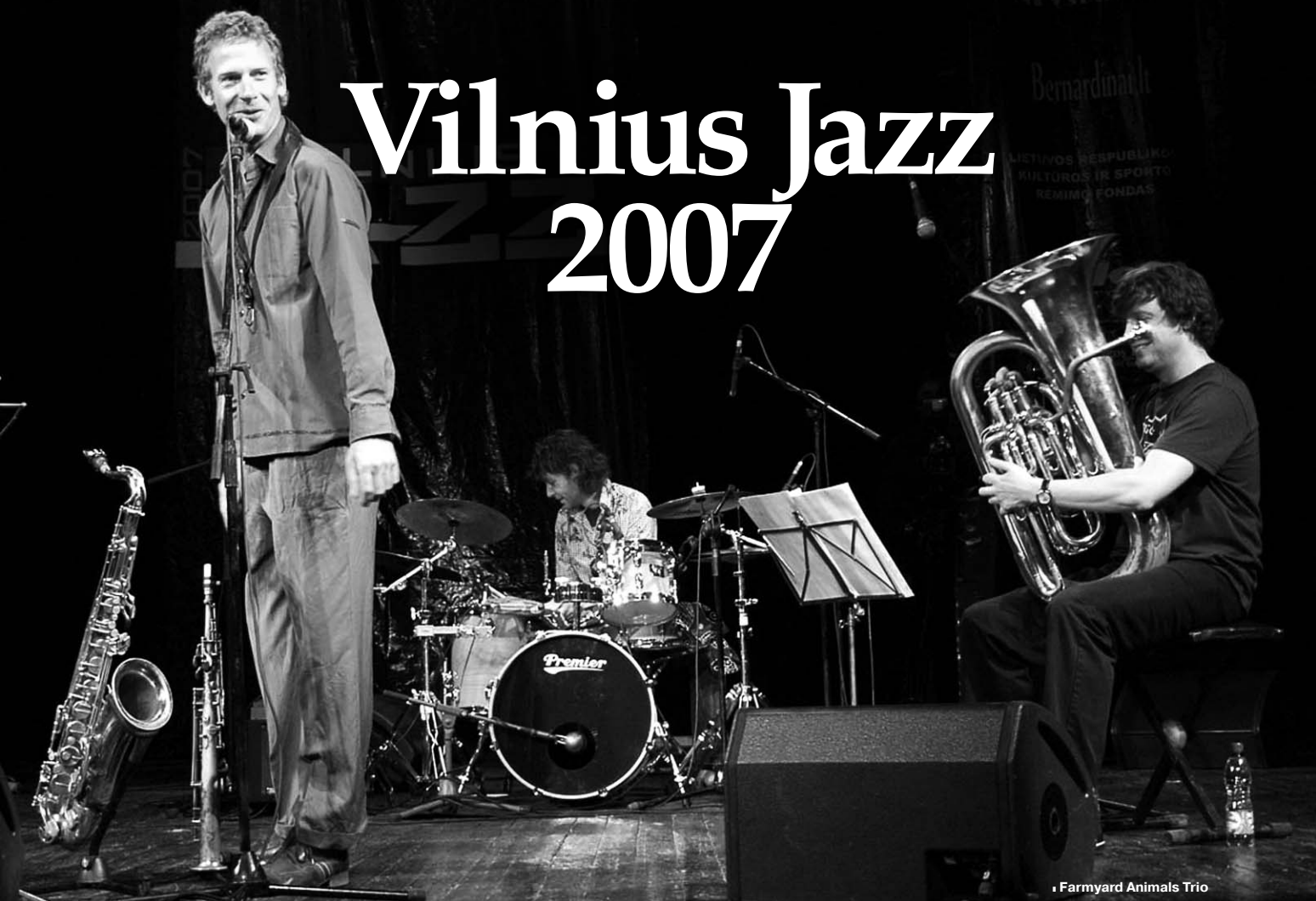
• Farmyard Animals Trio