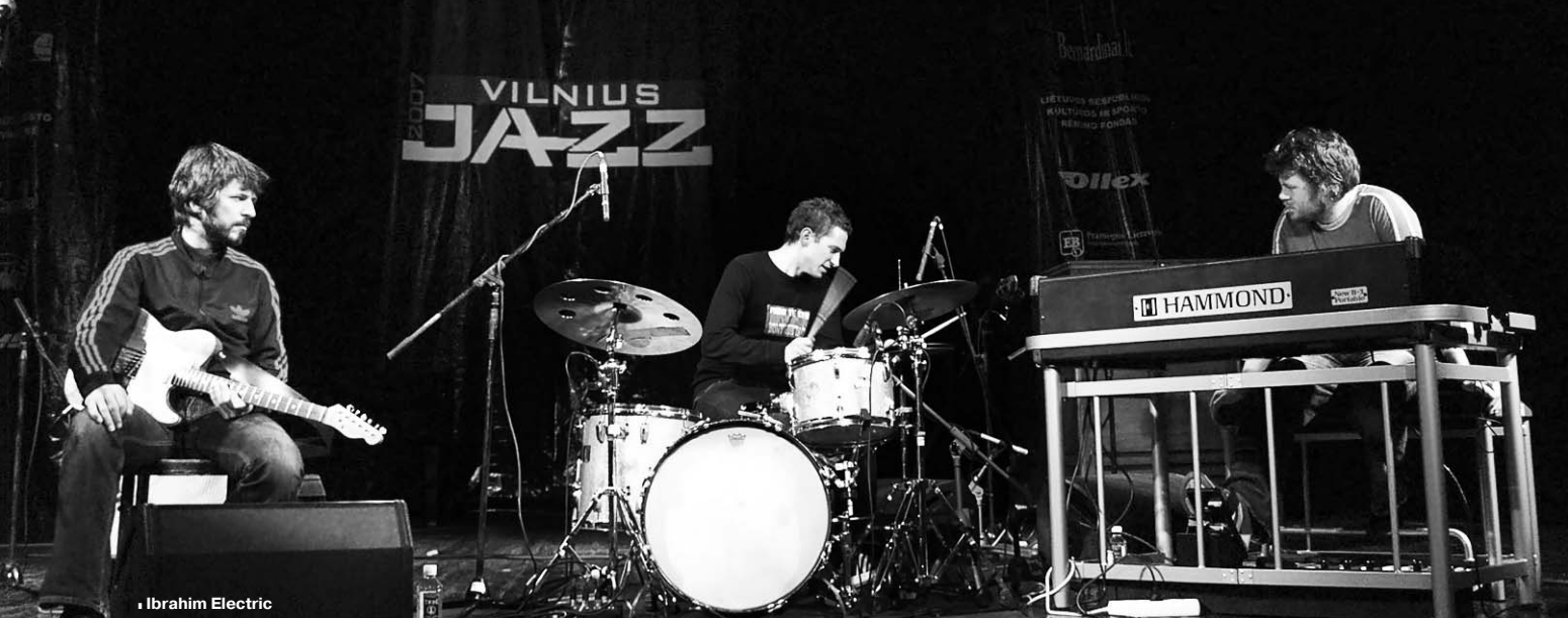
• Ibrahim Electric

ня Владимир Тарасов – уже легенда джаза литовского. Прошедший год для него также был юбилейным: летом он отметил свое 60-летие, но интерес к своей персоне все еще вызывает не геронтологический, а музыкальный... И вот вам главное впечатление от этого концерта: играют ли «динозавры» трибьют Шостаковичу или Living Space Джона Колтрейна, их главный талант даже не в самом звукоизвлечении. Обнаружить его можно только глазами: вы бы видели, КАК они слушают соло друг друга! Не перебивая.